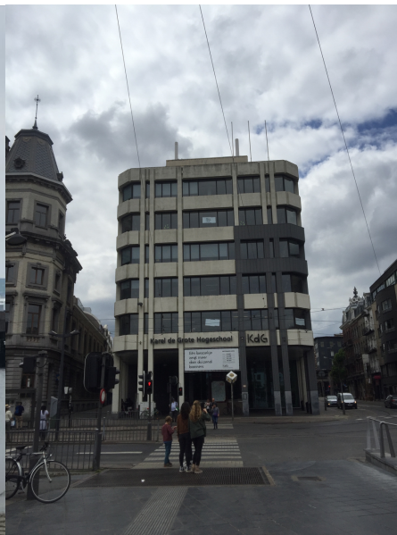
Frontansicht der KdG