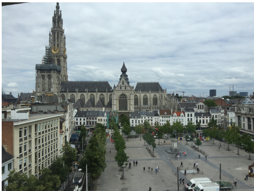
Aussicht aus der Karel de Grote