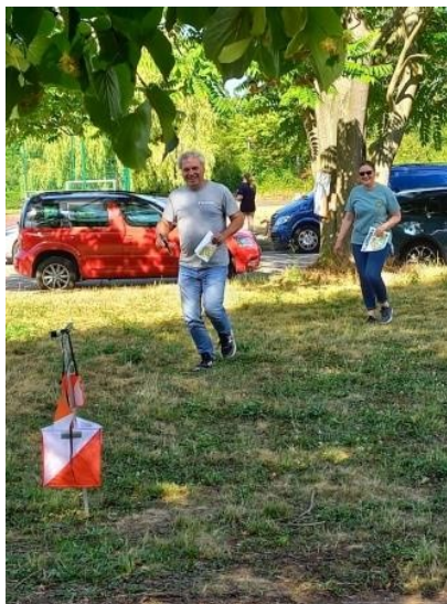
Volkssport- Orientierungsläufer beim OL auf dem Merseburger Campus 2022

Startgeld: Das Anfängerangebot (Bahn 2) ist für Hochschulangehörige und Studenten kostenfrei. Bahn 1 und 3 jeweils 3,-€ (zahlbar vor Ort gegen Quittung)