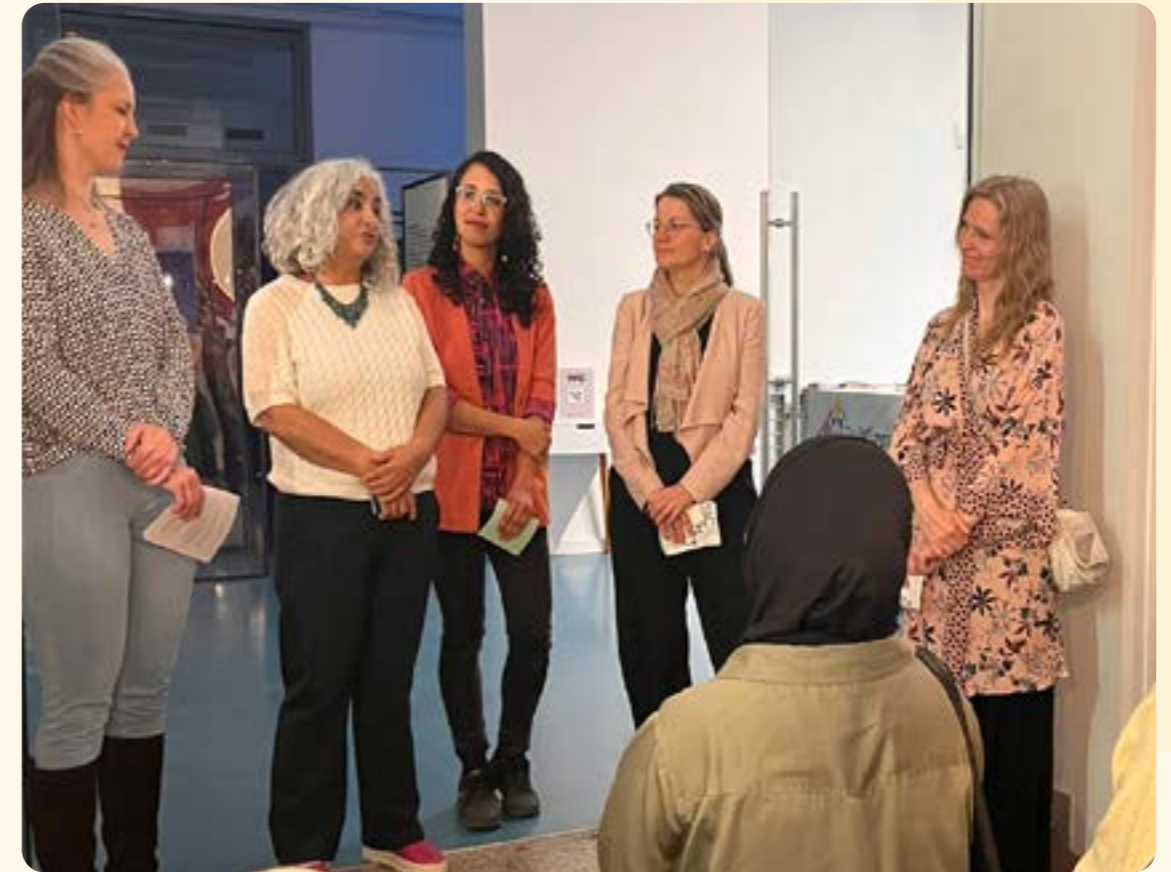
im Werkraum der Bühnen in Halle