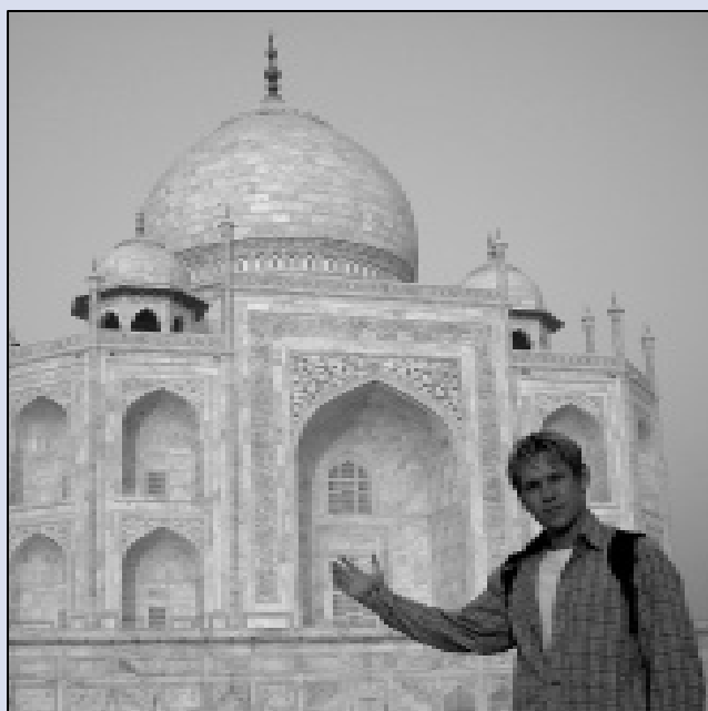
Sehr viel anders als beim Praktikum in Deutschland: Während der Freizeit standen unter anderem Ausflüge an den Indischen Ozean nach Goah und zum Taj Mahal in Agra auf dem Programm.