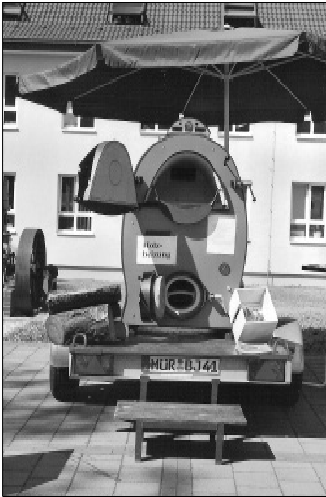
Hohe Öl- und Gaspreise sowie schwindende Ressourcen lassen die Möglichkeiten für erneuerbare Energien wachsen.