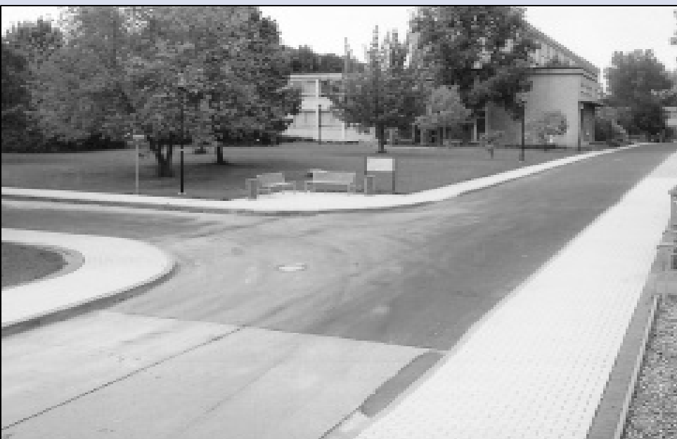
Links im Bild beginnt die Straße 06. mit ihr wurde die bereits im vergangenen Jahr begonnene Sanierung der Campusstraßen fortgesetzt.

Die im Rahmen der Campussanierung durchgeführten Entkernungsarbeiten im Hauptgebäude sind seit Anfang Juli abgeschlossen. Ende August/Anfang September begann dort mit der Baustelleneinrichtung nun die Rohbauphase. Durchgeführt wird der Rohbau von der Firma Heitkamp Ingenieur- und Kraftwerksbau, Niederlassung Bitterfeld.