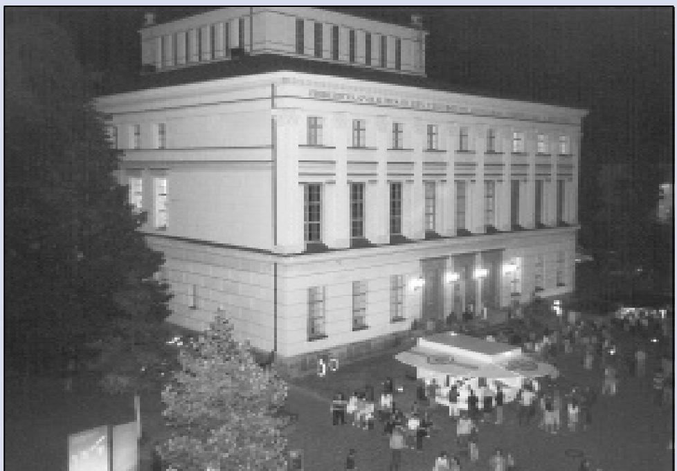
Blick aus einem Fenster des Melanchthonianums auf den nächtlichen Universitätsplatz