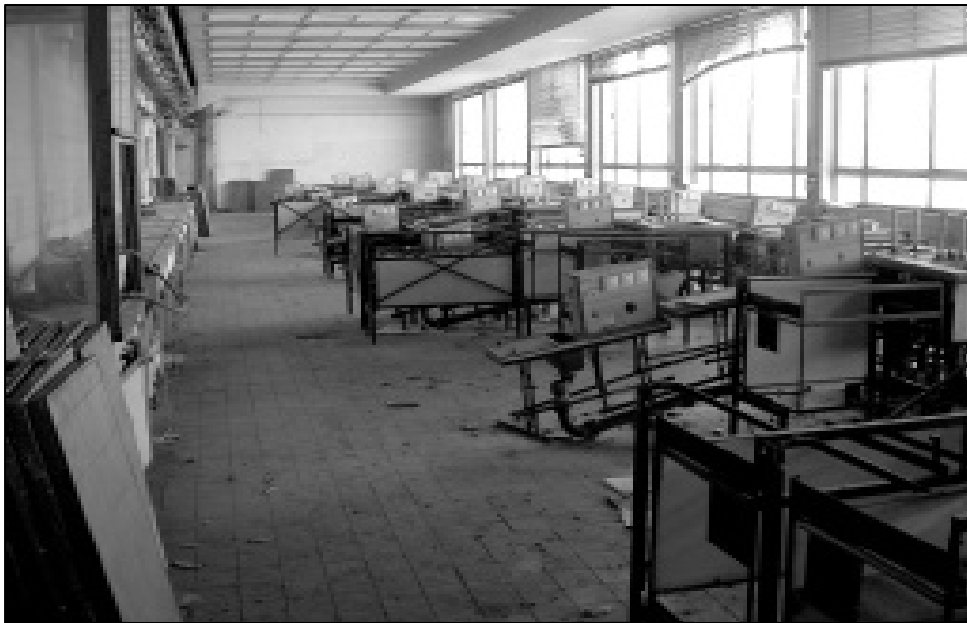
Demontage alter Labore im Zuge der Abbrucharbeiten

Mehrere Anfragen wurden während der Abbrucharbeiten zum Thema „Staubbelastung“ wie etwa „Gibt es im Zuge der Bauarbeiten Messungen in Hinblick auf Staub- und Asbestbelastung?“ gestellt. Dazu antwortete Wolfgang Hagemeyer, Sicherheitsingenieur der Hochschule: