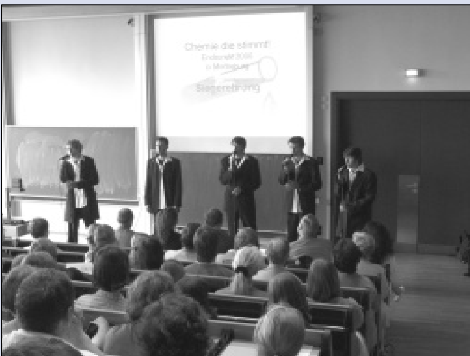
Das Ensemble „Mundart“ von der Landesschule Pforta begeisterte während der feierlichen Veranstaltung sein Publikum.

Musikalisch sehr gekonnt begleitet wurde die Veranstaltung von den fünf Vokalisten des Ensembles „Mundart“, alleamt Schüler der Landesschule Pforta.