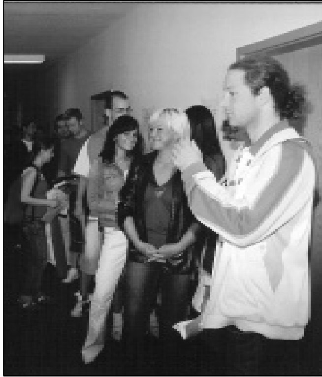
Warteschlange von zukünftigen Studierenden des Fachbereichs Soziale Arbeit, Medien, Kultur

Aufgenommen während der Einschreibungen Anfang September am Dezernat für Akademische Angelegenheiten